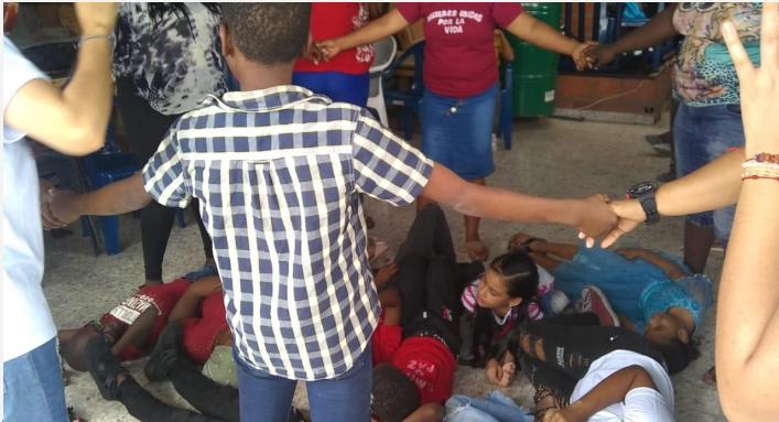
Pedagogía para la paz