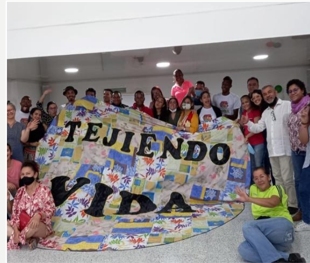
12 Voluntarixs para el fortalecimiento organizativo Dic 2021, San Fernando

Tras meses de asesorías legales, cuatro Asambleas y varios encuentros adicionales para el diseño organizativo