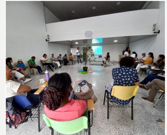
Reconfiguración de nodos y siembra Feb 2022, San Fernando